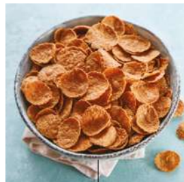
PÉTALES DE CÉRÉALES COMPLÈTES