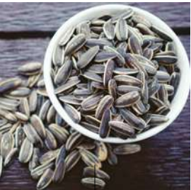
GRAINES DE TOURNESOL