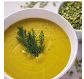
SOUPE AUX POIS CASSÉS