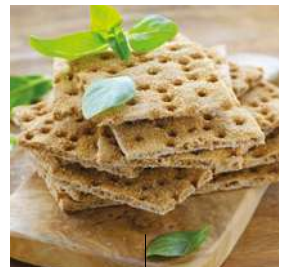
PAIN COMPLET CROQUANT SUÉDOIS