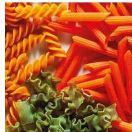
PÂTES AUX LÉGUMINEUSES