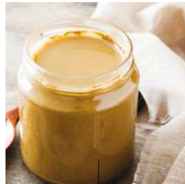
PURÉE DE FRUITS À COQUE OU GRAINES